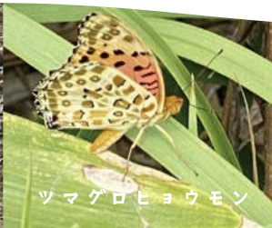
ツマグロヒョウモン