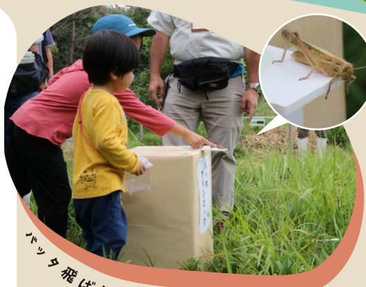
バッタ飛ばし競争