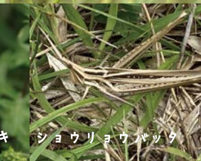
ショウリョウバッタ