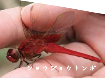
ショウジョウトンボ

※道路工事につき、一部通行を制限している可能性があります。 大阪立信太山 青少年野外活動センター 南海バス北信太駅筋より「鶴山台方面」行き乗車「鶴山台4丁目」下車 徒歩数分