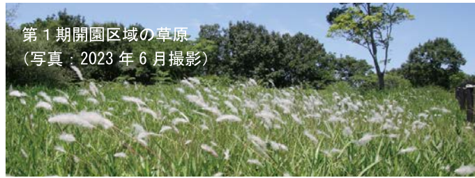
第1期開園区域の草原 (写真：2023年6月撮影)