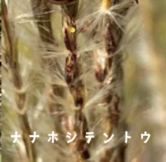
ナナホシテントウ